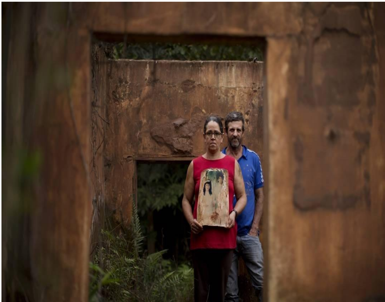
Jornal A Sirene – Para Não Esquecer ( http://jornalasirene.com.br/ )